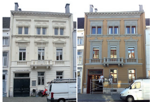
Voorbeeld van het resultaat van een verkennend kleuronderzoek. De gevel wordt opnieuw in de teruggevonden 'oude' kleurstelling geschilderd.

Voor kleurhistorisch onderzoek is een uitvoeringsrichtlijn (URL 2004 Kleurhistorisch onderzoek) opgesteld. Verzoek uw kleuronderzoeker om het onderzoek uit te voeren volgens deze richtlijn. U weet dan zeker dat u naar alle belangrijke zaken gevraagd hebt. U vindt de uitvoeringsrichtlijn op www.stichtingERM.nl .